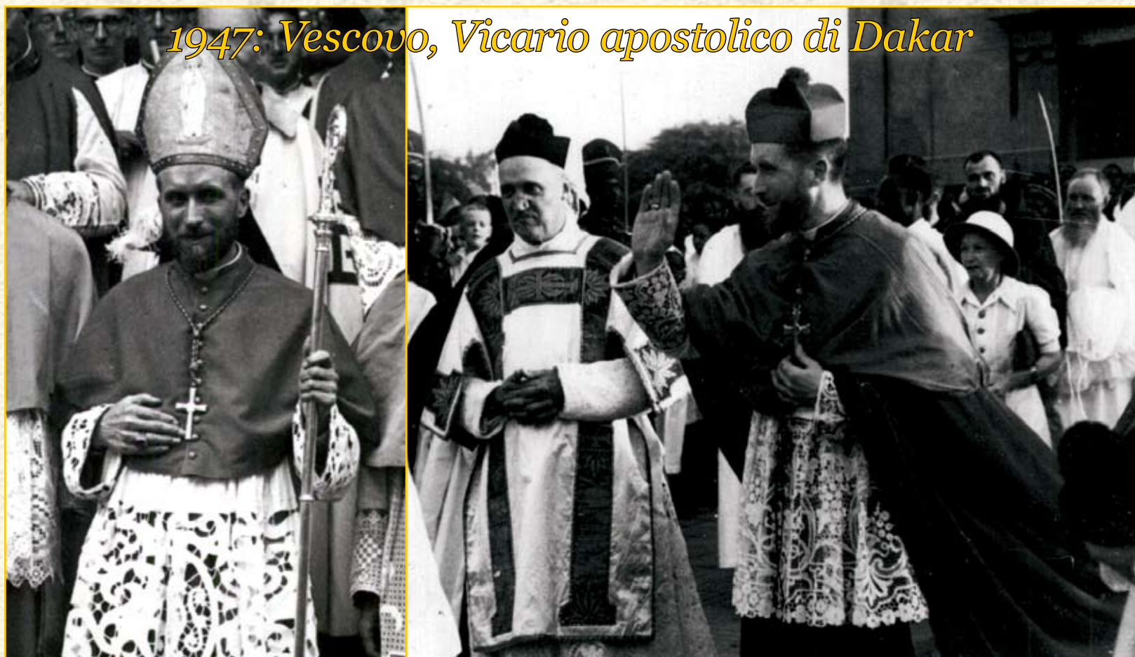
1947: Vescovo, Vicario apostolico di Dakar

29 giugno: Ordinazioni sacerdotali ad Ecône