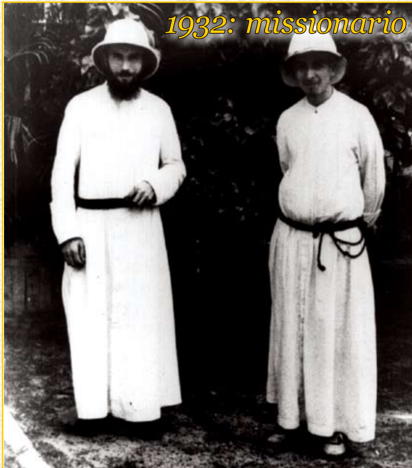
1932: missionario in Gabon (Africa)