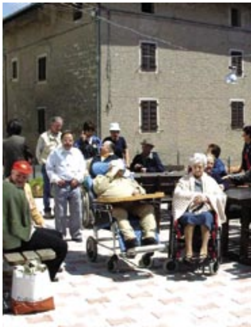
Il nostro futuro: un'Italia sempre più vecchia.

Il dato che colpisce di più osservando la tabella è quello relativo alle cifre aggregate dei giovani da 0 a 25 anni, che nel 1980 erano il 37,6% della popolazione e nel 2000 sono solo il 23%, confrontato con il numero degli anziani oltre i 50 anni che è passato dal 29,4% al 44,6%. In pratica oggi nella Unione Europea quasi una persona su due è oltre i cinquant'anni, mentre solo una persona su quattro circa è sotto i venticinque anni d'età.