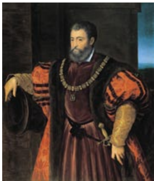
Il deposto Duca di Ferrara Alfonso d'Este

Il successo eccita il Papa, che ricade nella febbre, e lo si crede in punto di morte; ma il medico ebreo Samuele Sarfatti e la sua robusta natura lo salvano. Guarito in due giorni, denuncia alla Cristianità Luigi XII, che voleva appagare la sua sete criminale col sangue del Papa! L'11 dicembre l'offensiva è pronta: il Papa appare ornato di folta barba (ha fatto voto