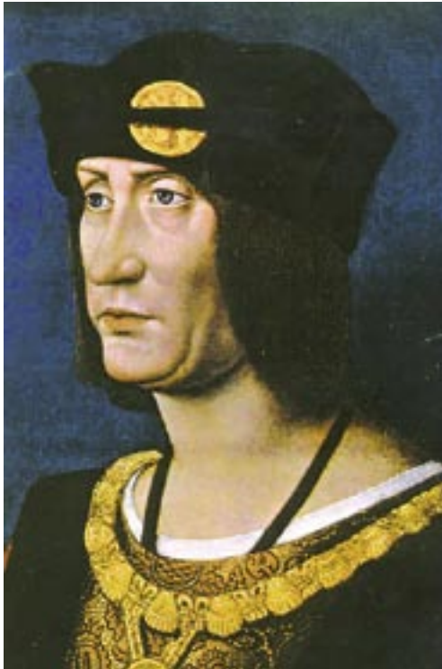
Lo scismatico re di Francia Luigi XII

quegli rispose «e noi faremo del S. Padre un parrochetto, se egli non sarà ragionevole». Il 22 marzo 1509 il Papa aderisce alla Lega di Cambrai, e il 27 aprile lancia la scomunica maggiore contro Venezia, per l'usurpazione delle terre della Chiesa. Venezia fa appello al Concilio, presso il Cardinale Bakaz, Primate di Ungheria e Patriarca latino di Costantinopoli (che naturalmente non risponde). Iniziano le ostilità generali, alle quali i veneziani rispondono con coraggio credendo che la Lega non sarebbe durata. Ma in un giorno cadono le loro illusioni: il 14 maggio, con la battaglia di Agnadello (presso Cremona), ha fine l'avanzata di Venezia in terraferma, e l'esercito pontificio col Duca d'Urbino irrompe in Romagna. Tutto il territorio veneziano fino a Verona compresa è in mano agli alleati.