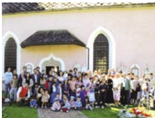
Foto di gruppo (poteva mancare?) dopo la Messa cantata in onore dell'Assunta. Ma non ci sono tutti...