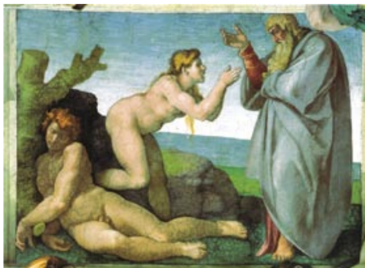
Michelangelo, La creazione di Eva , Roma, Cappella Sistina.

Dio; ma ciò è evidentemente impossibile. Questo fine ragionamento metafisico è più semplicemente espresso dal profeta Isaia: «Così dice il Signore, che crea i cieli e li distende, che ha stabilita la terra con tutto quello che germoglia da essa, che dà il respiro al popolo che vi abita...: “Io sono il Signore, questo è il mio nome; la gloria mia non darò ad altri, né il mio onore ai simulacri”» (Is 42, 5.8).