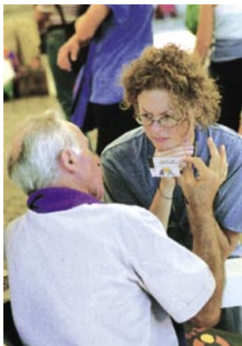
Una confessione alla Giornata Mondiale della Gioventù del 2000 a Roma.

del matrimonio e iniziando nei confessionali – è ciò che si è costretti a pensare – una politica di ampia tolleranza verso pratiche di controllo della natalità che di cattolico, e anche semplicemente di cristiano, non avevano più nulla. Va ricordato infatti che, mentre ancora in Humanae Vitae Paolo VI ricordava come, perché fosse moralmente lecito ai coniugi ricorrere ai metodi naturali di regolazione delle nascite (unendosi solo nei periodi naturalmente infecundi), occorreva che sussistessero seri e gravi motivi (così sintetizzabili: certezza medica di gravi rischi per la vita e la salute della madre nel caso di una nuova nascita; certezza o probabilità molto elevata di malformazioni genetiche per il nascituro o di altri gravissime alterazioni del suo stato di salute; situazione oggettiva e già in atto di grave povertà e indigenza, impossibilità o incapacità di provvedere all'educazione della prole); viceversa, a partire dall'inizio del suo pontificato, Giovanni Paolo II ha ricordato innumerevoli volte che occorre che i coniugi ricorrano solo ai metodi