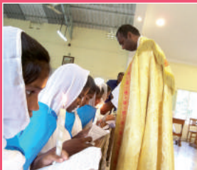
Figlie di Maria.