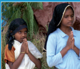
Scene da una recita su Fatima.