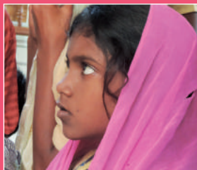
Future figlie di Maria.