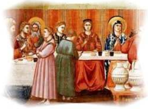
Le nozze di Cana Istituzione del sacramento del matrimonio

Per ciò che riguarda l'ecumenismo e il dialogo interreligioso, questa continuità era già apparsa in modo evidente, con la visita, scalzo e in preghiera, alla Moschea Blu, oppure in occasione delle diverse visite alle sinagoghe (più numerose di qualunque altro Papa p. 122). In particolare a quella di Roma dove ha chiamato gli Ebrei attuali "popolo dell'Alleanza" lasciando chiaramente intendere che l'Antica Alleanza sia ancora in vigore, dichiarando che preghiamo insieme "lo stesso Signore" benché essi rigettino Gesù Cristo (vedi Veritas n° 71 marzo 2010), oppure quando per la prima