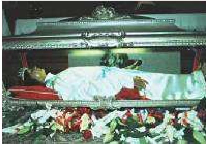
Santa Maria Goretti Martire della purezza

In coerenza con questo principio il pontefice afferma che: “Le Chiese orientali sono vere Chiese particolari, sebbene non siano in comunione con il Papa. In questo senso l’unità con il Papa non è costitutiva per le Chiese particolari” (p. 133). Ma la Chiesa ha sempre insegnato che, proprio perché scismatiche, queste chiese si sono separate dal Papa che è la fonte dell’autorità e non possono dirsi vere chiese, non potendo reclamare la