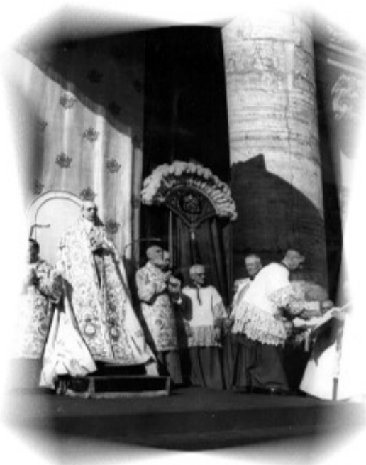
Pio XII, definizione del dogma dell'Assunzione

Nell'ambiente mediatico attuale, in certi argomenti, soprattutto nei punti della morale dove la Chiesa Cattolica rappresenta l'unica voce a insegnare ancora la Legge naturale, mi sembra che ci voglia la massima prudenza e chiarezza nell'espone la dottrina. La dichiarazione sull'uso del profilattico che sarebbe giustificato in singoli casi ha fatto scalpore ( Luce del mondo p. 170). Certi moralisti si sono sforzati di giustificare la cosa, altri affermano che tale affermazione è inaccettabile. In ogni caso non sembra proprio inerente alla prudenza pastorale dire al mondo che questo caso sarebbe un'eccezione alla regola o addirittura un "primo passo verso una moralizzazione" (Op. cit. p. 171) perché fatto con l'intenzione di non nuocere al prossimo. Questo sembra del tutto legittimare un peccato perché viene commesso con una buona intenzione. I mass media che stanno in agguato per sfruttare la minima debolezza da parte della Chiesa in questa materia, non hanno mancato