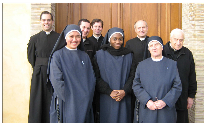
La comunità del Priorato